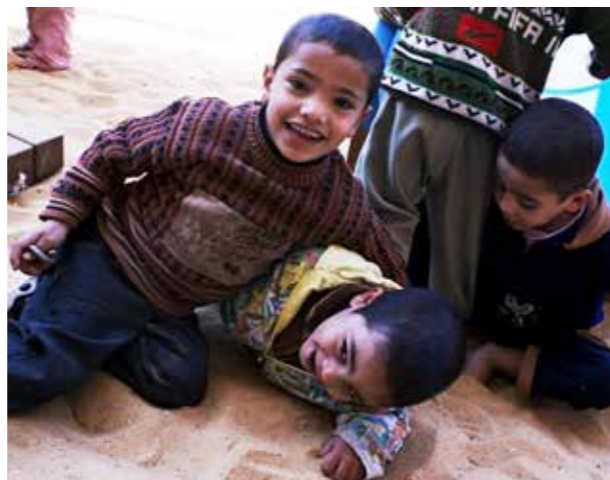
Axelent är fadderföretag åt DGSS barnhem i Egypten.

Axelent ska stödja verksamheter, engagemang i välgörenhetsprojekt och ideella organisationer där det finns någon form av koppling till Axelent som företag.